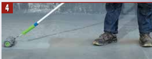
4 Нанесете хидроизолацията Ceresit CP 30 по основата с четка, валец или машинно.