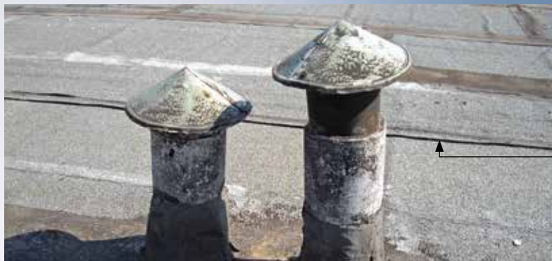
Ceresit CP 27