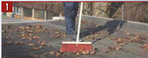
1 Почистване на покрива