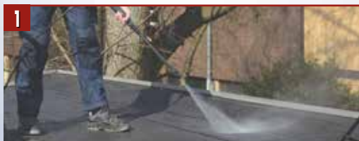
1 Почистване на покрива