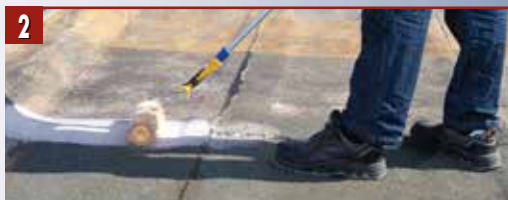
2 Нанесете грунд Thomsit R 766 (ако се налага) по основата с четка или валец.