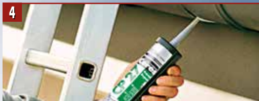
4 Ceresit CP 27 също така е подходящ за запълване на малки отвори и пукнатини - например по покривни улуци и водосточни тръби.