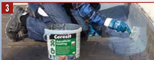
3 Нанесете хидроизолацията Ceresit CP 30 по ъглите и бордовете с четка, валец или машинно.