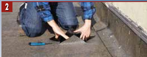
2 Внимателно разрежете мястото, което ще се ремонтира и го разтворете.