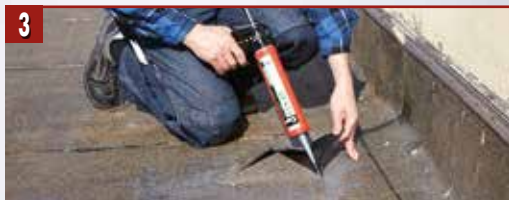
3 Нанесете от Ceresit CP 27 под старата хидроизолация и притиснете добре докато засъхне уплътнителя.